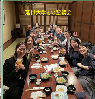
延世大学との懇親会