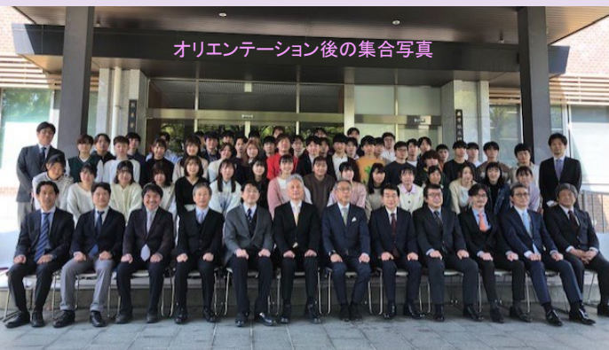
オリエンテーション後の集合写真