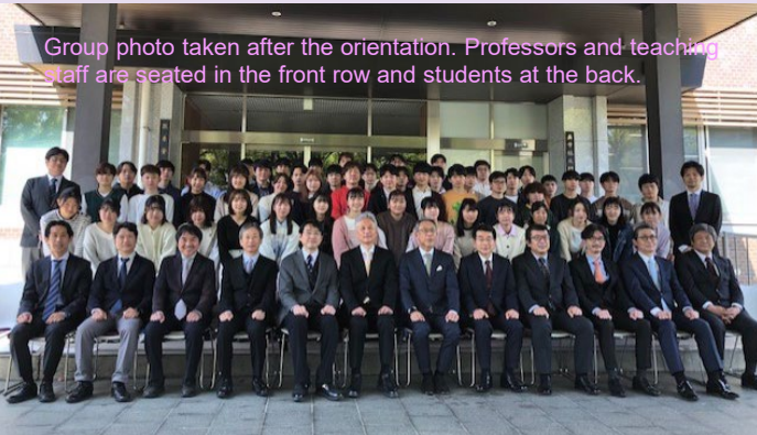
Group photo taken after the orientation. Professors and teaching staff are seated in the front row and students at the back.