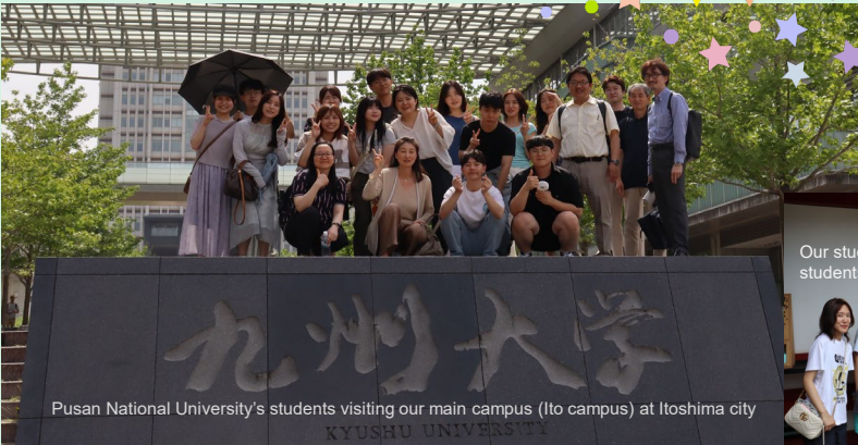
Pusan National University's students visiting our main campus (Ito campus) at Itoshima city