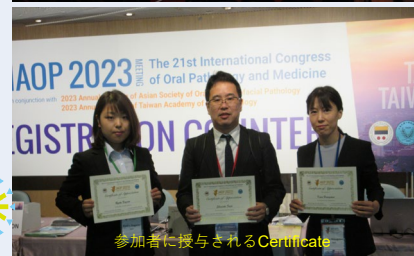
参加者に授与されるCertificate