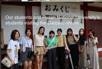
Our students and Pusan National University's students visiting the Daizaifu shrine