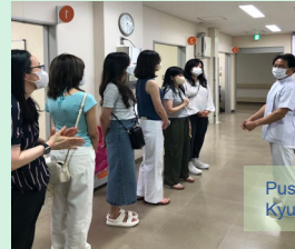
Pusan National University's students visiting our Kyushu University Hospital